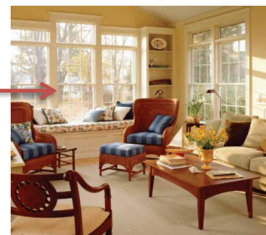
※こちらの写真はイメージです